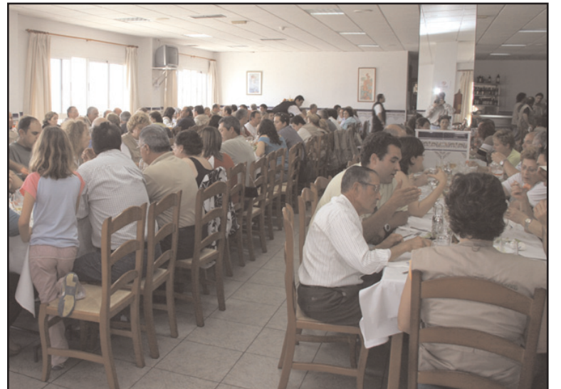
200 Personas degustaron la gastronomía abderitana/ Utrera