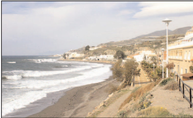
La asociación lucha por unos espigones para el litoral abderitano.

"Los cerca de dos mil vecinos de La Caracola, a la