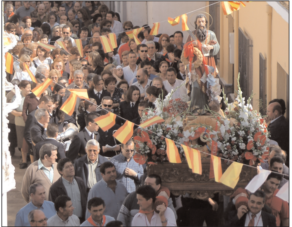
San Marcos en su recorrido de procesión por la estación/Utrera

En Adra la hermandad de San Marcos Evangelista, despliega un gran abanico de actividades que comienza con la eleccion de la reina, hasta el recorrido de la estación del 3 de Mayo. Pero en Adra, San Marcos por excelencia es el 25 de Abril, día que los burros y caballos se ponen de gala para desfilan por las calles abderitanas. Este día comienza con una santa misa y una ofrenda al santo, seguidamente continua con una procesión por las calles del casco antiguo y una romería por la vega.