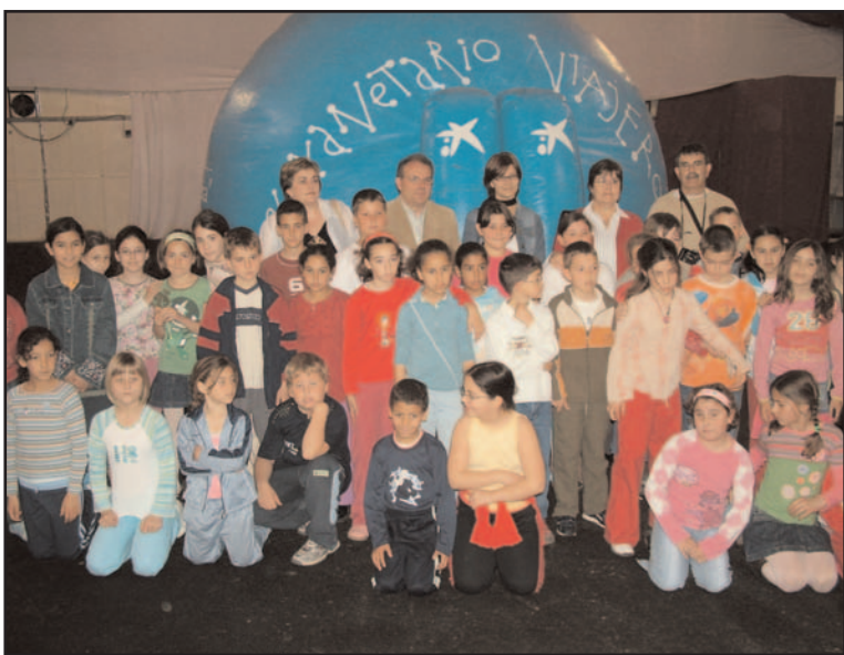
Escolares en el planetario viajero de la Caixa