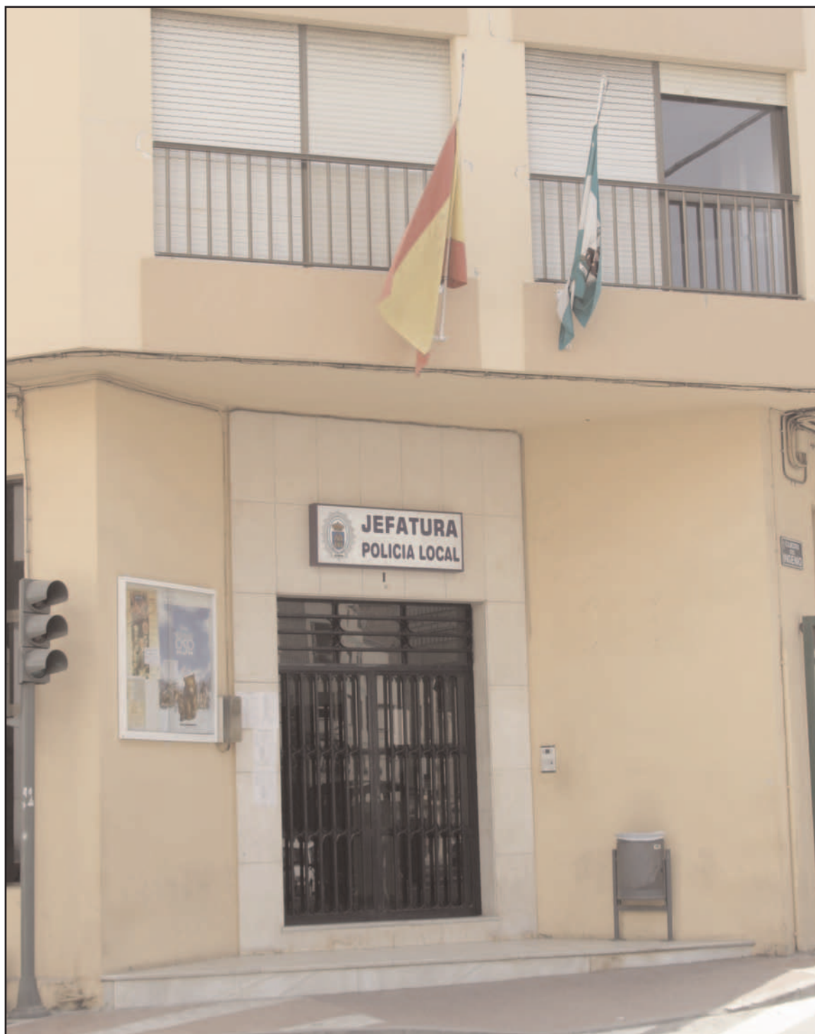
Jefatura Policia Local de Adra