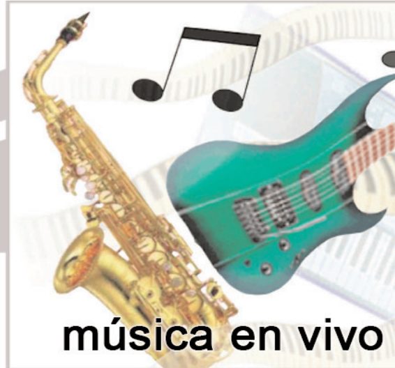
música en vivo