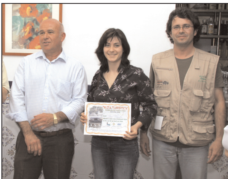
Africa Villegas en representación de Utrera Fotografos/ Utrera