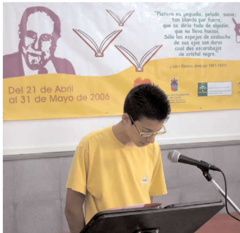
Un joven recitó un poema de Juan Ramon Jimenez

Tras la entrega de premios ha tenido lugar la lectura, por parte de los presentes, de fragmentos de poemas de algunas obras de Juan Ramón Jiménez, y posteriormente se hizo entrega a la Antorcha de las Letras, a los alumnos del IES 'La Gangosa' donde a partir del lunes se llevará a cabo el maratón de fomento a la lectura que durante más de un mes recorrerá todos los centros de enseñanza del municipio.