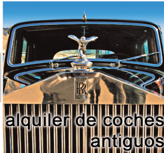
alquiler de coches antiguos

Antes de dar el "si quiero" Conócenos, luego no hay marcha atrás.