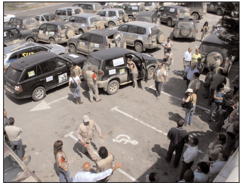
Llegada de los todoterrenos al restaurante Rivera y Brao/ Utrera