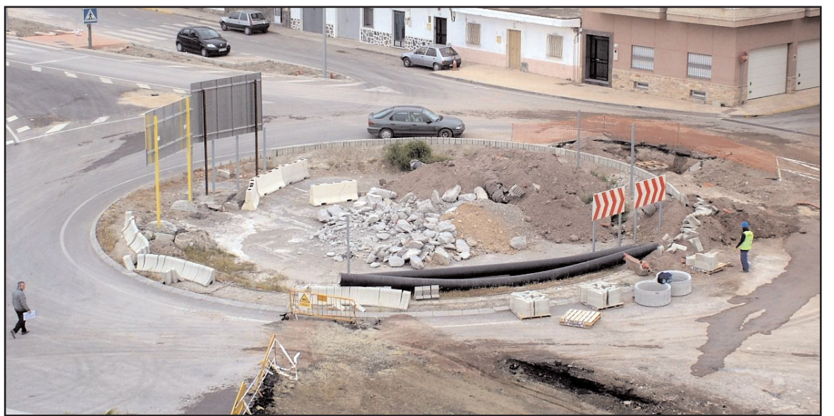
Las obras van a buen ritmo