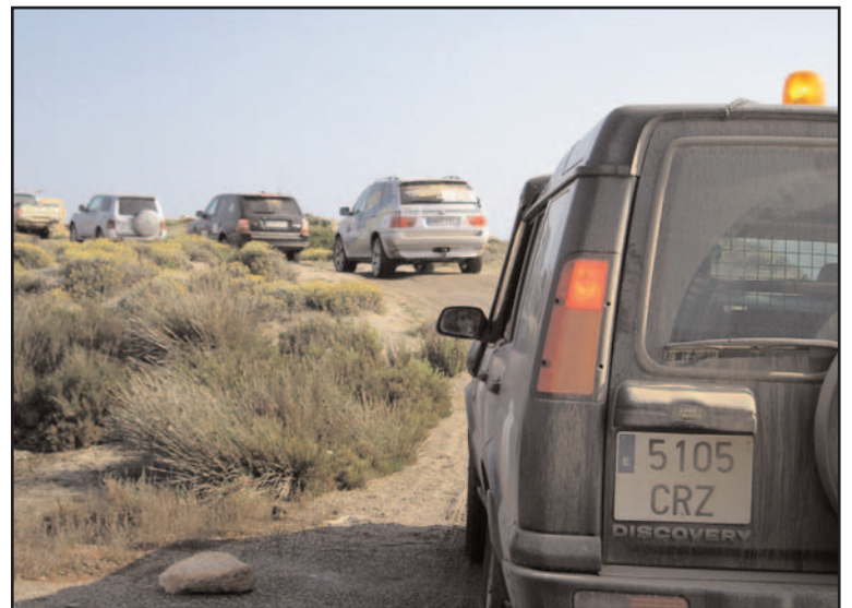
La caravana de 4x4 en su 4ª Etapa de paso por Almería/ASONEPTUR

El Participante más lejano proviene de Santander. Hay una alta participación de Cataluña y Madrid. Aunque este año es especialmente significativa la participación de "ruter" andaluces, desde Aljaraque o la propia Punta Umbría hasta El Ejido en Almería; de Huelva, Sevilla, Coin, Motril y Granada, completan la participación andaluza.